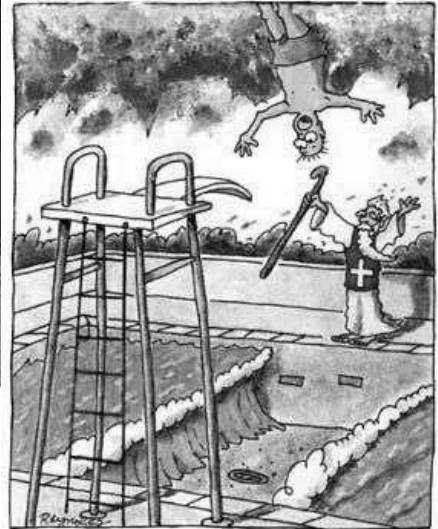
Moses' erster und letzter Tag als Bademeister