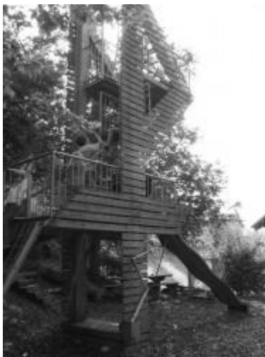
Blüemu (Fabian Bluem)