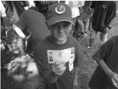
Max zeigt einen Fünfiger

Der Brief an die anderen Familienoberhäupter ist raus. Sie werden bestimmt nicht zufrieden sein wenn sie sehen wie gut meine Geschäfte laufen. Ich habe gerade eben wieder eine riesige Ladung an Zerstörungsware nach Deutschland geschickt bestimmt werden wir